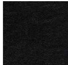
Carla Black plastic-coated fabric* قماش أسود مغطى بالپلاستيك