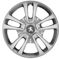
16 inch 'San Francisco' wheel trims* طرزاز عجلات سان فرانسيسكو 16 إنش