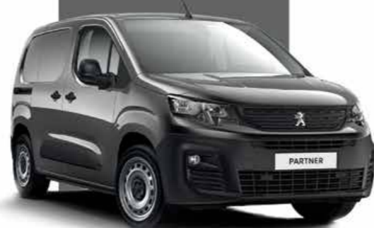
Platinum Grey رمادي بلاتيني