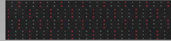
Darko/Twill Black – Red cloth upholstery

فرش داخلي مصنوع من القماش المنقش بالأسود والأحمر