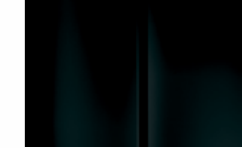
Black Perla Nera ألوان ثابتة