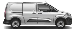
LONG VAN فان طويل