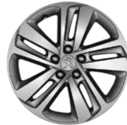
17 inch 'Phoenix' alloy wheels* طرزاز عجلات فونيكس 17 إنش