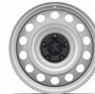
16 inches black plastic cover غطاء بلاستيكي أسود 16 إنش