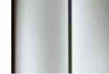
Artense Grey رمادي لامع