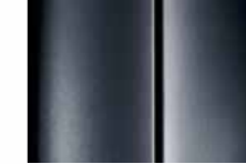
Platinum Grey رمادي بالاتيني