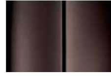
Rich Oak Brown