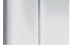
Ice Field White