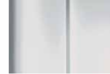
Ice Field White أبيض ناصع