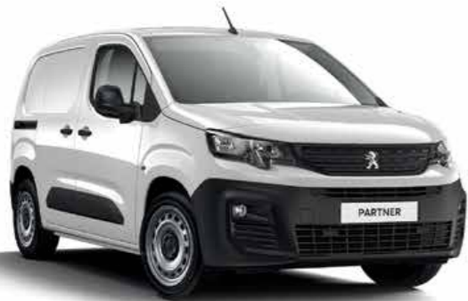
Banquise White أبيض بنكيز