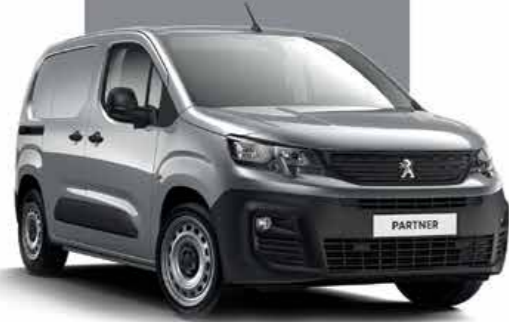
Arctic Steel فولاذي أركتيك