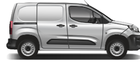
SHORT VAN فان قصير